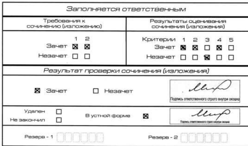
Рис. 11. Область для оценки работы сочинения (изложения) в устной форме