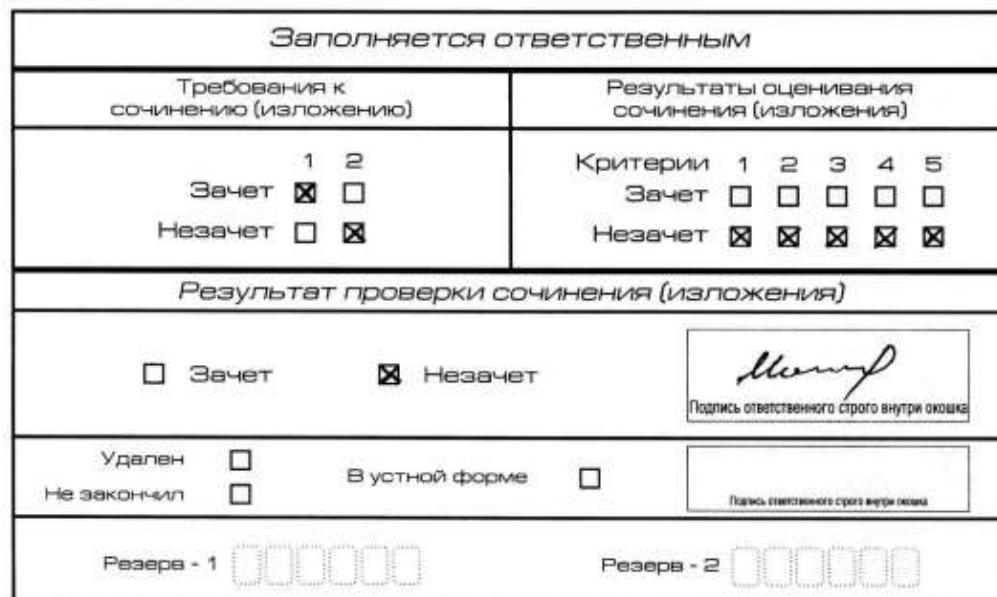
Рис. 9. Область для оценки работы