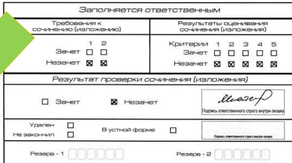
Рис. 8. Область для оценки работы